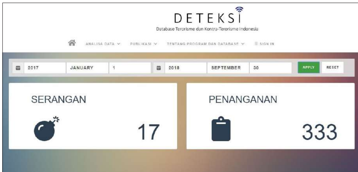
Gambar 1. Jumlah serangan dan Penangan Terorisme di Indonesia Januari 2017-September 2018

mengidentifikasi dirinya juga sebagai korban 8 . Beberapa pihak menganggap bahwa korban adalah orang-orang yang menderita karena serangan teror, tetapi beberapa pihak yang lain memandang bahwa pelaku adalah korban dari penyebaran ideologi radikal-ekstrem 9 . Bahkan, dalam beberapa kasus, beberapa pihak mengklaim bahwa mereka ada pihak yang paling menderita dibandingkan dengan pihak lain. Oleh karena itu, sangat penting untuk menetapkan secara jelas batasan-batasan yang dapat dipergunakan untuk mengklasifikasikan seseorang sebagai korban atau bukan dalam sebuah tindak pidana terorisme. Perubahan UU pemberantasan tindak pidana terorisme yang baru saja disahkan bisa menjadi pegangan untuk mengurangi perdebatan tersebut.